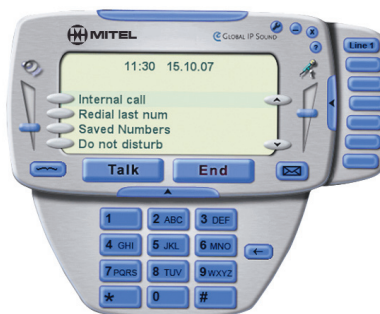
Téléphone logiciel Mitel 5110 Softphone